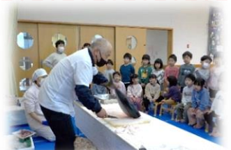
2/19 お魚ふれあい教室 (ほし・たいよう)