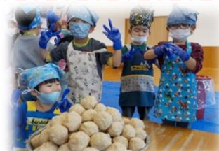
2/9 味噌作り (たいよう)

17日(土)清掃奉仕第3班の方には、窓拭き、エアコン、換気扇掃除、木の剪定など大変きれいにしていただき、ありがとうございました。