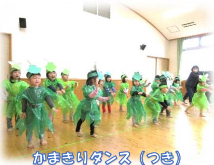
かまきりダンス (つき)