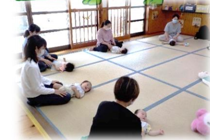
親子活動 (ちょうちょ)